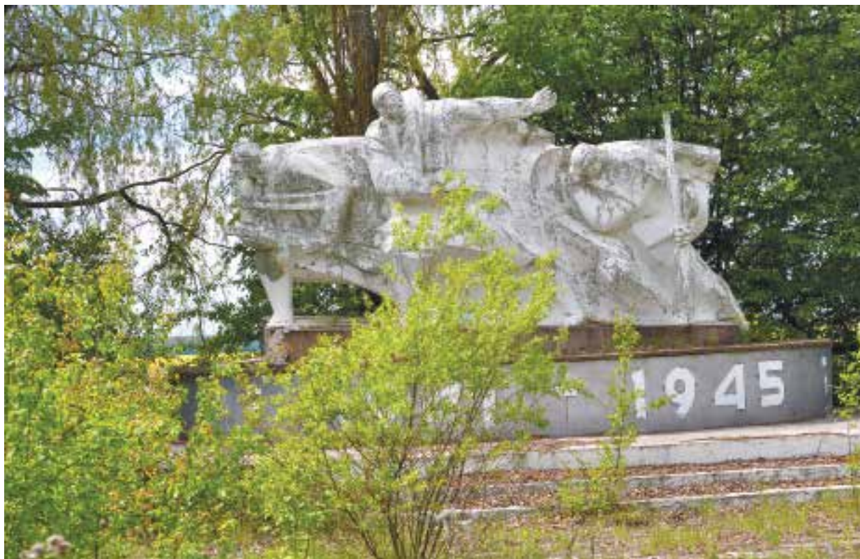
Напередодні Дня пам'яті та примирення – рейд місцями шани полеглим землякам читайте на 4-й стор.