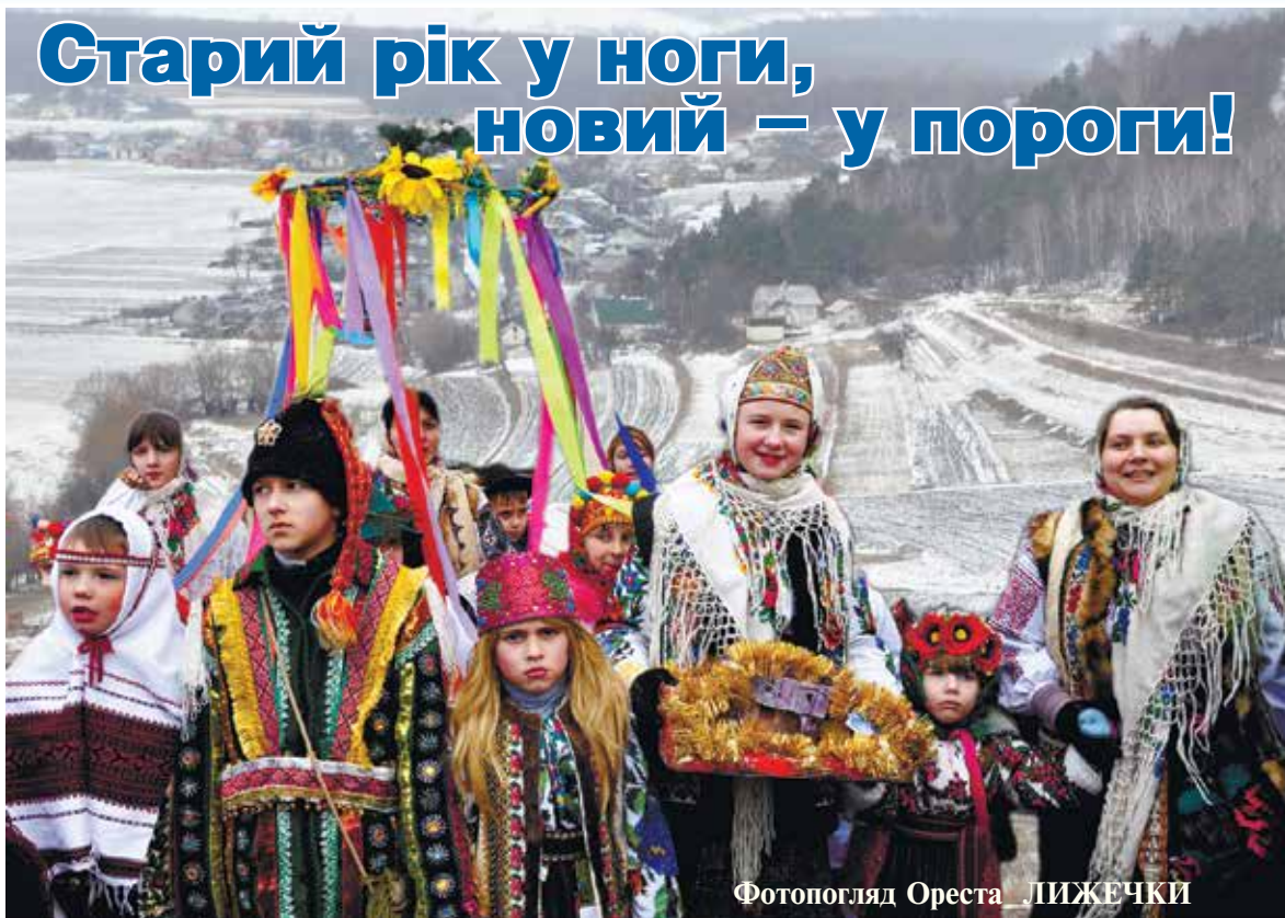
Фотопогляд Ореста ЛИЖЕЧКИ