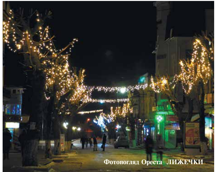
Фотопогляд Ореста ЛИЖЕЧКИ