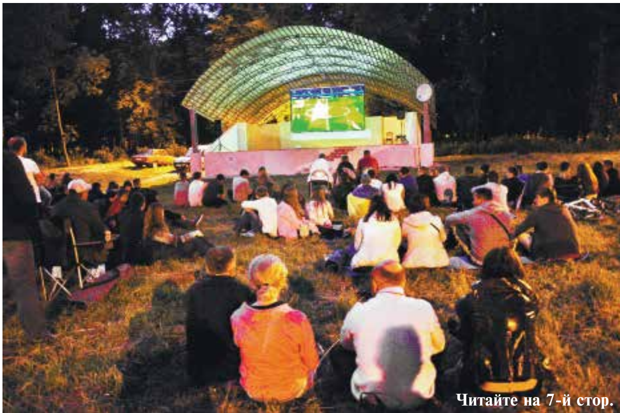
Читайте на 7-й стор.