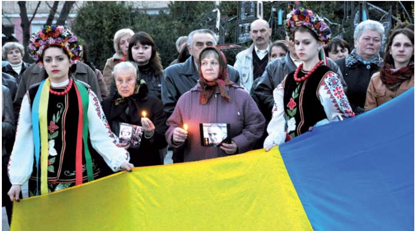
30 березня минуло сорок днів скорботи за полеглими Героями Небесної сотні. Чортківщина, як і вся Україна, проводжала синів своїх загиблих у світлу путь вічної пам'яті.

Плаче свічка, ронячи сльози, І священник молиться з хрестом... Ще кривавлять рани, душу огортають невимовні біль і туга... Тепер, як ніколи досі, розумієш глибоке значення тієї фрази зі Славня: «... Душу й тіло ми положим за нашу свободу...». Правда відкрилася ціною життів Героїв Небесної сотні й тисяч побитих, скалічених людей; на превеликий жаль, лік постраждалих поповнюється... Допоки?! У неділю, надвечір, чортківський май-