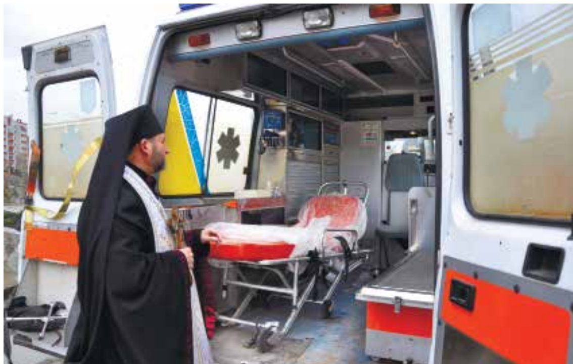
Читайте на 4-й стор.