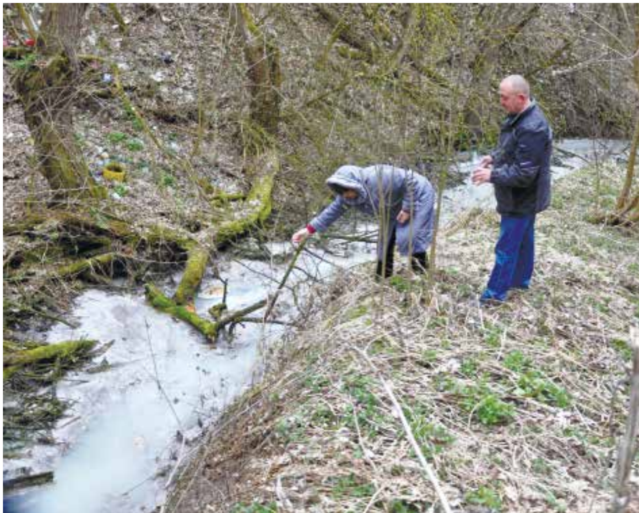
Читайте на 3-й стор.