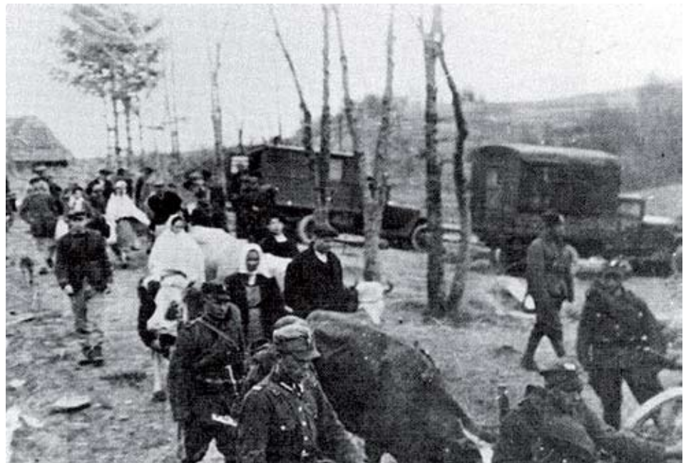
щий догляд, ніж дерев'яні сакральні пам'ятки у самій Україні.

Нині в пресі акцію «Вісла» часто називають «етноцидом». Але тоді не йшлося про масове фізичне знищення. На меті була асиміляція – зміна національної самосвідомості й релігії. Частково цієї мети досягнуто. Утім, на нових землях українці створили школи й каплиці. Сьогодні на теренах виселеної Лемківщини українські дерев'яні церкви мають значно кра-