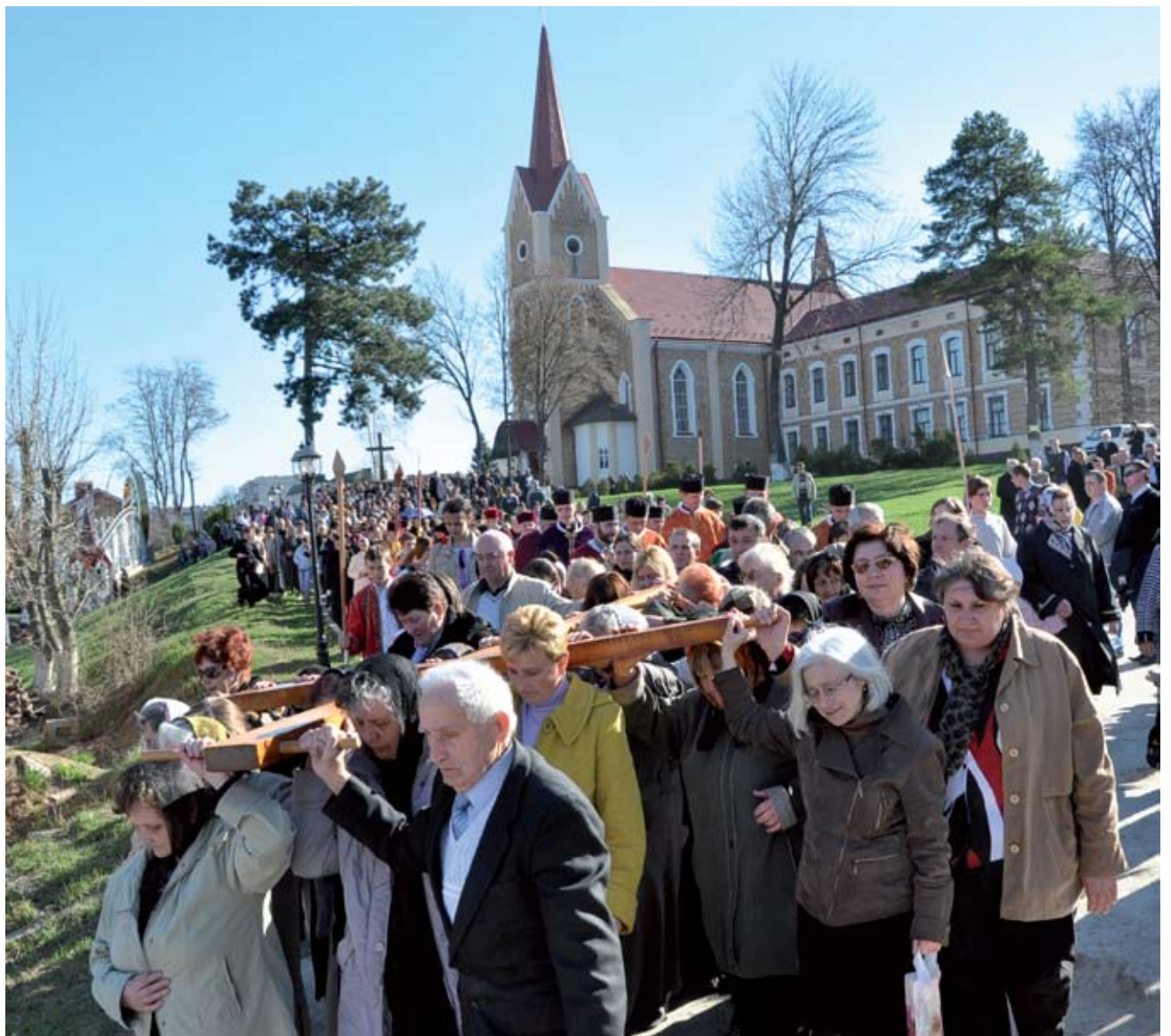
Минулотижневий недільний день був виповнений світлом: світлом сонця й світлом духовності, релігійності, віри. Християни Чортківського краю зібралися разом, щоб ще раз пройти дорогою Христа – 21 квітня відбулася хресна хода вулицями міста.

Хресна хода вже традиційно розпочалася з відправи в одній з найстаріших церков нашого міста – Вознесіння Господнього. Благословив та провів Хресну дорогу правлячий архієрей Бучацької єпархії УГКЦ Дмитро Григорак, ЧСВВ, разом із духовенством Чортківщини. Цей хід об'єднав у спільній молитві священників та вірних греко-католицької, римо-католицької і православної громад.