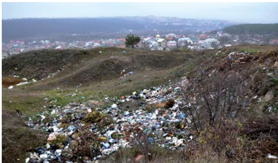
Околиця Синякового... Мешканці зручно облаштували стихійне сміттєзвалище. І байдуже, що саме воно отрує доквілля та й їх самих.

У передвеликодній час уже стало доброю традицією, що кожен добрий господар дбає про ошатність свого обійстя. Направду, більшість господ міста усміхається сонячною чепурністю. І доквілля де-не-де доводили до ладу. Запитаєте: чому «де-не-де»? Бо, на жаль, фотофакти засвідчують, що далі свого носа мешканці міста й не бачать. Подвір'я, вулиці прибрали... А сміттям байдуже доповнили мальовничі пейзажі околиць... Навіщо ж завадати собі зайвого клопоту, вивозячи увесь непотріб подалі, на міське облаштоване сміттєзвалище, якщо можна, так би мовити, «на тачки» – і неподалік у посадку!