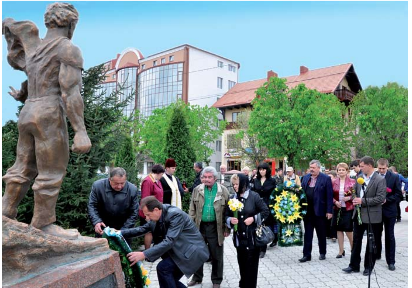
У переддень 28-ї річниці чорнобильської трагедії, 25 квітня, зібралася небайдужа чортківська громадськість біля пам'ятника жертвам катастрофи аварії на ЧАЕС, щоби уклінно віддати шану тим, хто, не шкодуючи ні життя, ні здоров'я свого, прийняв нерівний бій зі смертоносним атомом.

26 квітня 1986 рік... Близько до півдругої ночі на четвертому енергоблоці Чорнобильської АЕС стався вибух, який повністю зруйнував реактор. Із двох наявних приладів для вимірювання радіації на 1000 рентген на годину один вийшов з ладу, а інший був недоступний через завали. Тому в перші години аварії ніхто точно не знав реальних рівнів радіації в приміщеннях блоку і довкола нього. Пізніше встановлять – радіоактивний викид потужністю в 300 Хіросім.