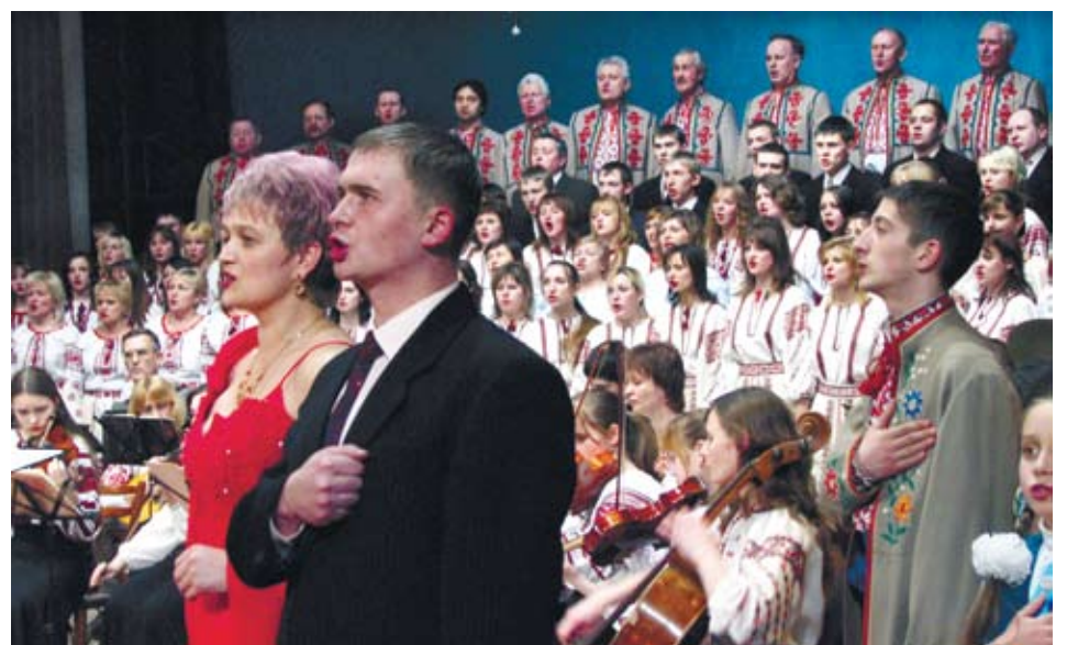
Творчий звіт Чортківського району в Палаці культури «Березіль» (2008 р.)

Творчий звіт-концерт майстрів мистецтв та аматорських художніх колективів Чортківського району відбувся 25 червня 2004 року в Тернопільському академічному обласному українському драматичному театрі ім. Т.Г.Шевченка і присвячувався 8-й річниці прийняття Конституції України – «Любіться, брати мої, Україну любіть». Розпочалося дійство літературно-музичною композицією «Державність України збережемо», а завершилося кантатою А.Кушніренка «Молось за тебе, Україно!». Учасників урочистого зібрання привітав голова Чортківської районної