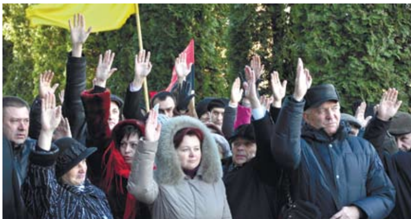
ні Яблонь, котра повідомила, що друге засіданні президії депутати виступили з