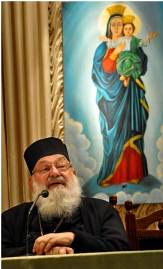
Таку тезу доводив до свідомості чортківчан на зустрічі минулої п'ятниці у РКБК ім. К.Рубчакової архієпископ-емерит, колишній глава нашої Української Греко-Католицької Церкви Його Блаженство Любомир Гузар.

Любомир ГУЗАР: «Якщо хочеш послужитися Україні – стань політиком. Але добрим політиком»