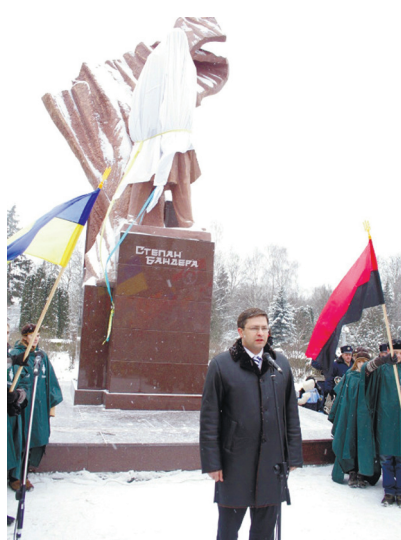
адміністрацію фактично ніхто не вважав реальною владою, і працювали на цій посаді два з половиною роки. Чи справлялися?

– Ми маємо помилкове уявлення про інститут влади. Коли влада проявляє силу – ми її боїмося, коли вона дає свободу – ми її зневажаємо. Ми хотіли демократії, але не усі були готові її зрозуміти, сприйняти і захистити. Між демократією і анархією тонка грань, переступивши яку суспільство рано чи пізно дійде до диктатури. Тільки тоді воно зрозуміє істинний зміст і цінність демократії.