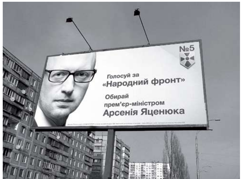
Чи залишиться Арсеній Яценюк на посаді прем'єра? Це залежить від результату, який «Народний фронт» отримає на виборах

Не відстає від Юлії Тимошенко і лідер «Сильної України» Сергій Тігіпко. Головними гаслами своєї кампанії він зробив «світ» і «економіку». Так і хочеться запитати, а чому Сергій Тігіпко в лютому не прийшов на засідання Верховної Ради, коли вона голосувала за припинення вогню? І що він зробив з економікою і пенсіями, займаючи пост віце-прем'єра